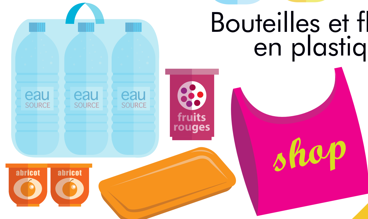
Sacs et films plastique, yaourts, barquettes alimentaires