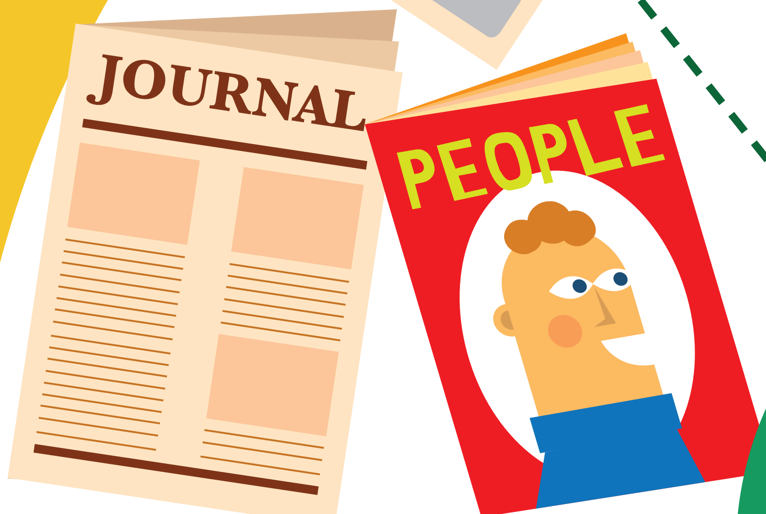
Journaux, magazines prospectus, enveloppes