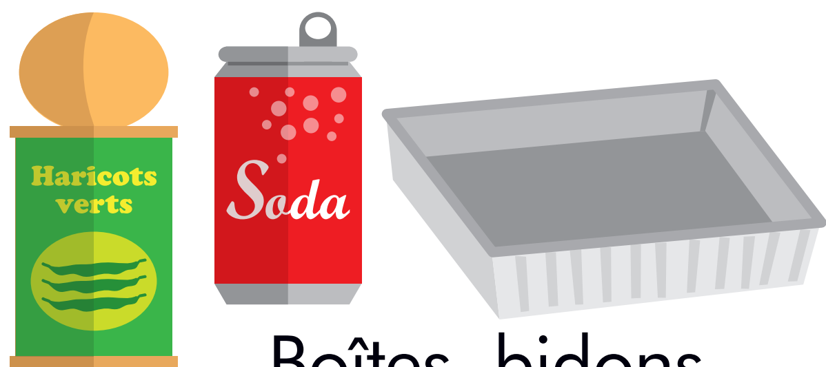
Boîtes, bidons et canettes métalliques, barquettes en aluminium