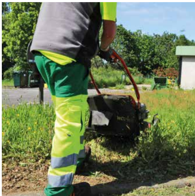
▲ La gestion différenciée de certains espaces enherbés permet de faire du mulching, technique de tonte sans ramassage de l'herbe.

à discuter avec le berger lors de ses visites hebdomadaires.