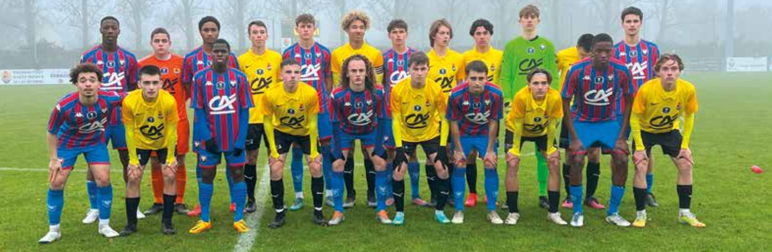
▲ Les U18 des Paotred Dispout ont atteint cette saison le 1 er tour fédéral en coupe Gambardella, équivalent de la Coupe de France chez les adultes, s'inclinant 2-0 contre le SM Caen à Lestonan.