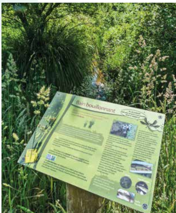
▲ Situé sur les landes de Kerho en Lestonan, le Sentier des Demoiselles est un sentier d'interprétation de la faune et de la flore où la vie dans et autour du ruisseau y est expliquée au fil de panneaux aussi ludiques que complets.

essences. L'idée était de créer un poumon vert au cœur de Lestonan tout en réalisant une jonction entre la résidence de personnes âgées de Coat Kerhuel et le bois de Stang Luzigou. De petites mains vertes ont participé à la plantation : chaque élève gabérisois est venu à l'époque mettre en terre un jeune plant, chaque classe ayant choisi au préalable une espèce particulière sur laquelle les enfants se sont documentés.