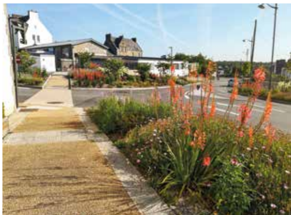
▲ Pour les parterres, les agents des espaces verts utilisent différents paillages naturelles.

En 2015, on a pu croiser une quinzaine de chèvres à Kerho ainsi que deux vaches d'origine écossaise, des Highland cattle. Une prairie humide d'un peu plus d'un hectare, inaccessible aux machines, avait été gérée à l'époque. Une opération renouvelée en septembre 2022 au Bourg où six moutons dont un agneau avaient pris possession d'une parcelle municipale rue du Jet, et ce jusqu'à cet été 2023. Une présence animalière qui améliore le cadre de vie des riverains et favorise le lien social, tous les publics venant voir les animaux, en famille, seul ou entre amis, et prenant plaisir