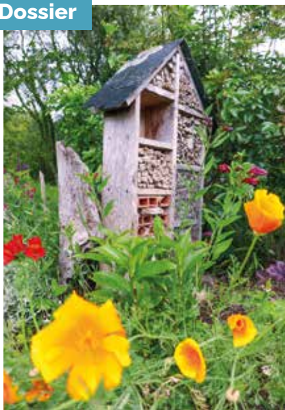
▲ Aux jardins familiaux de Pen Carn, un hôtel à insectes permet d'agir sur la conservation de la biodiversité tout en disposant d'un outil de sensibilisation